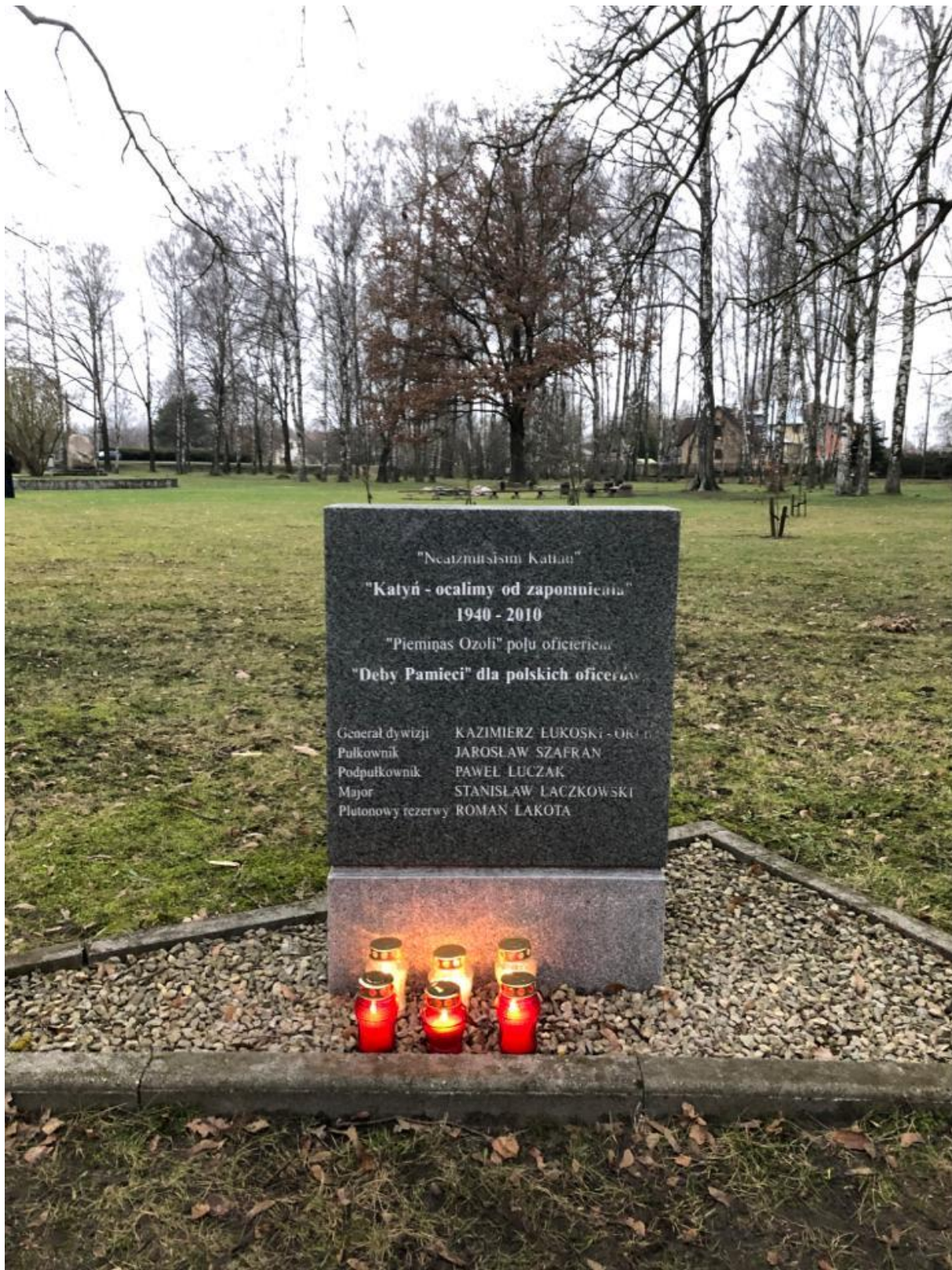
Jelgava – przy tym samym skwerze miejscowi Polacy postawili tablicę upamiętniającą ofiary Katynia