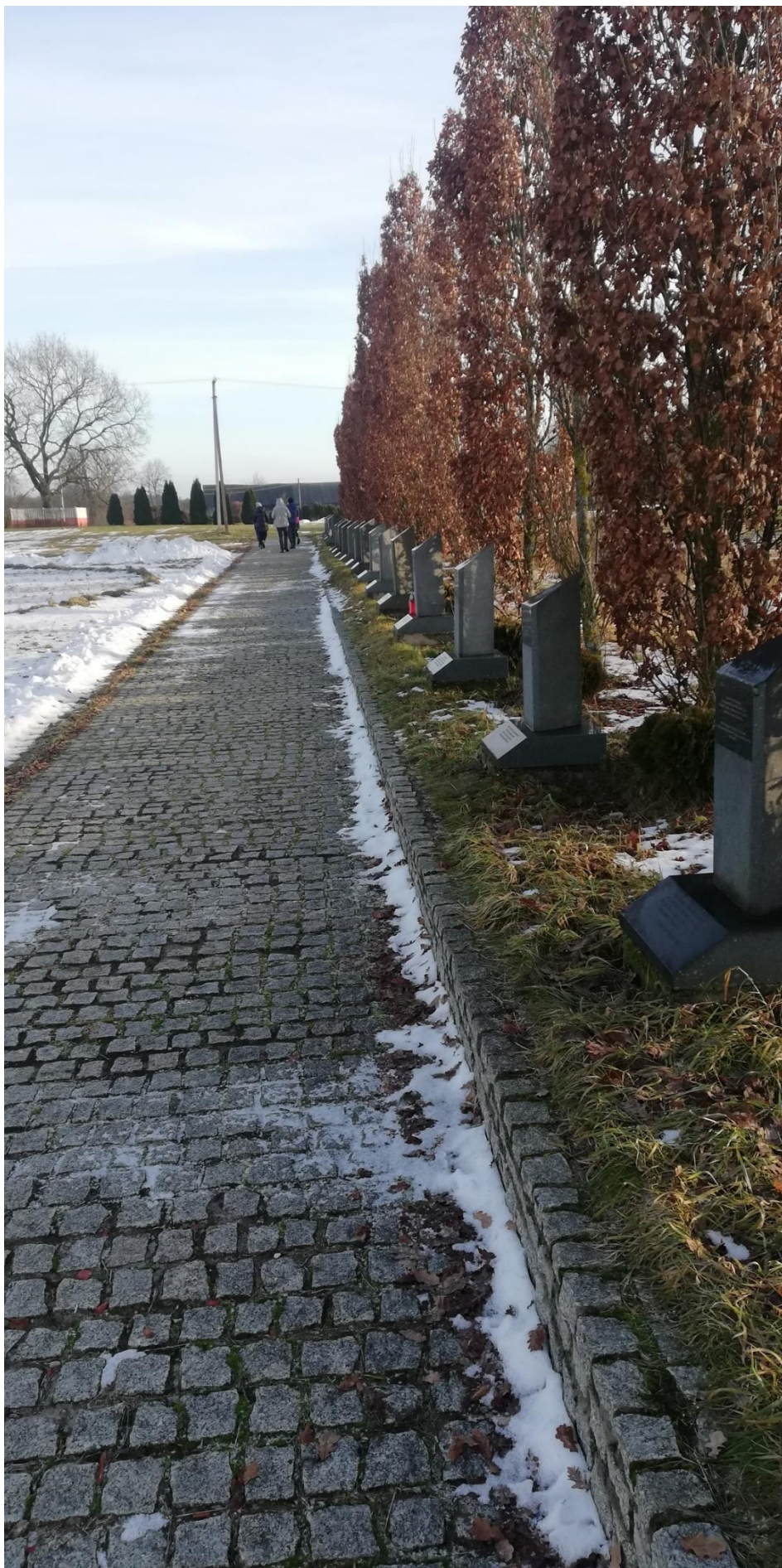
Aleja pamięci w Zutowie