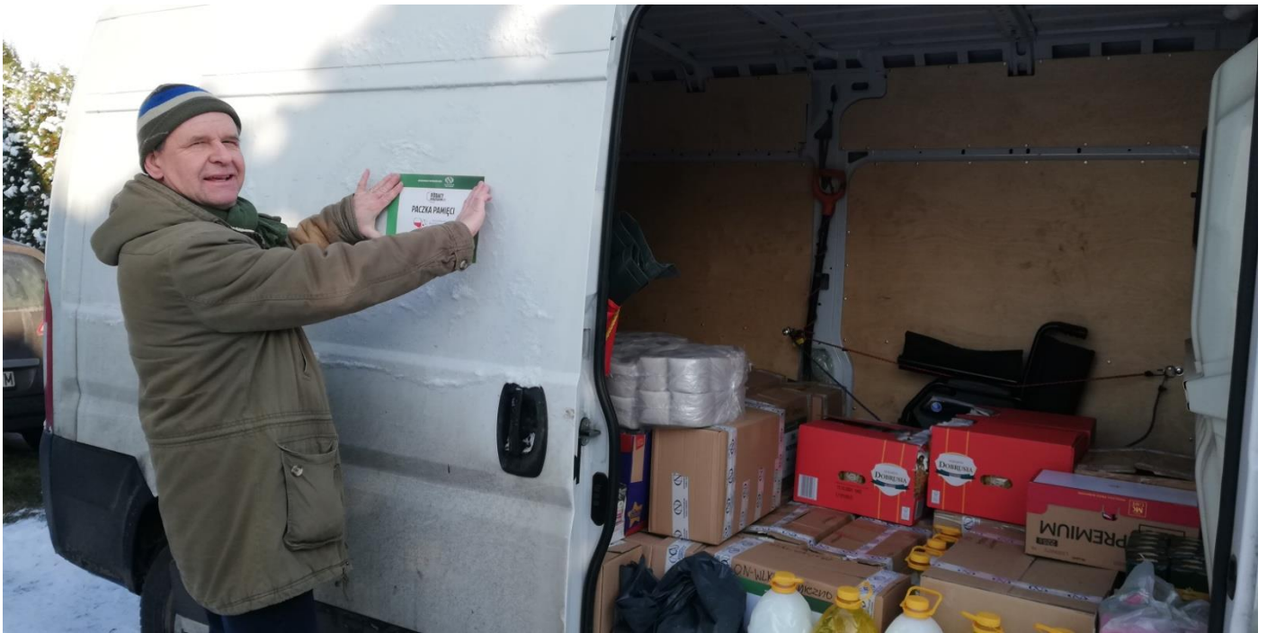
Samochód zapakowany i gotowy do wyjazdu. Jeszcze tylko nalepka na drzwi .