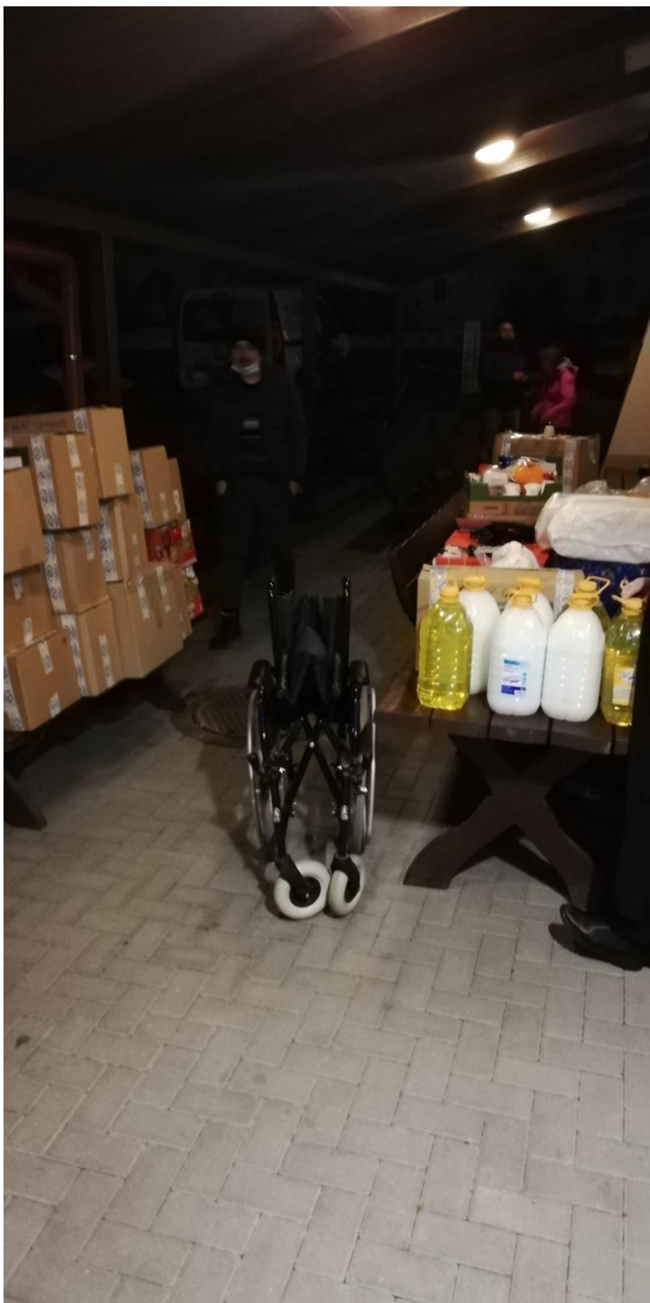
Rozładunek darów dla hospicjum w Wilnie (około 500kg produktów)