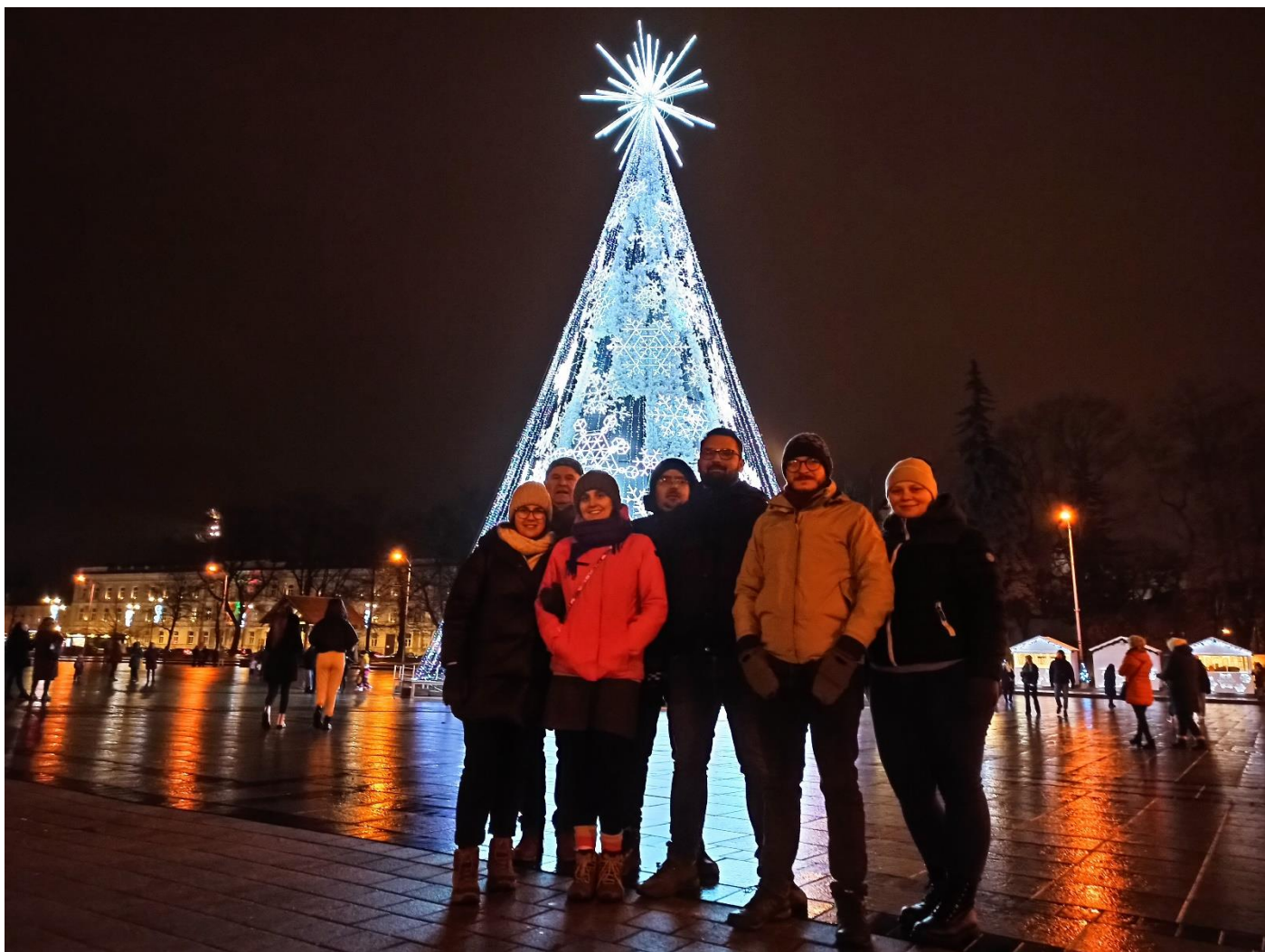
Wilno, plac przed katedrą