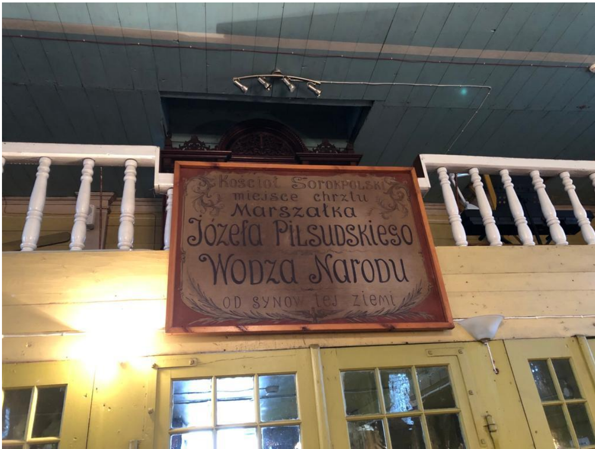
Powiewiórka – chór w kościele.