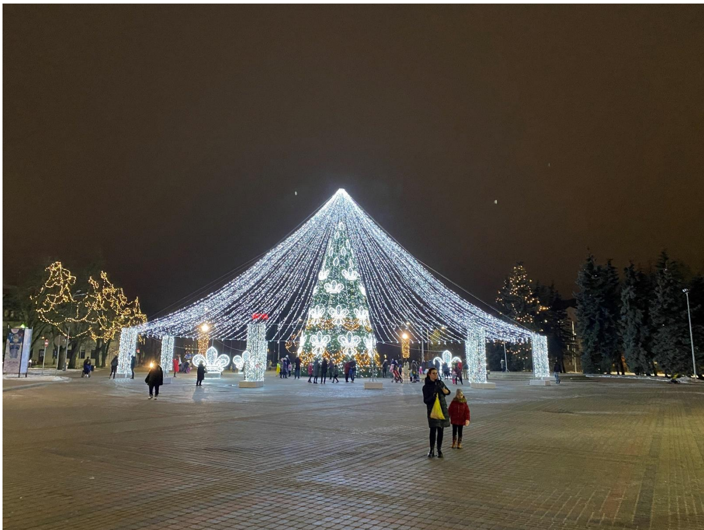
Łotwa - deptak w Daugavpils, kiedyś to był Dyneburg a jeszcze wcześniej Dźwińsk.