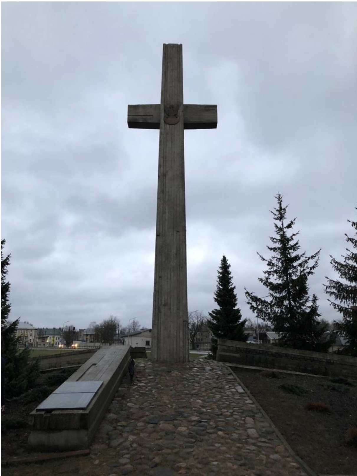
Daugavpils (Łotwa) – pomnik na byłym cmentarzu polskich żołnierzy, cmentarz zniszczyli Sowieci, a w latach 90-tych na jego miejscu Łotysze wybudowali pomnik