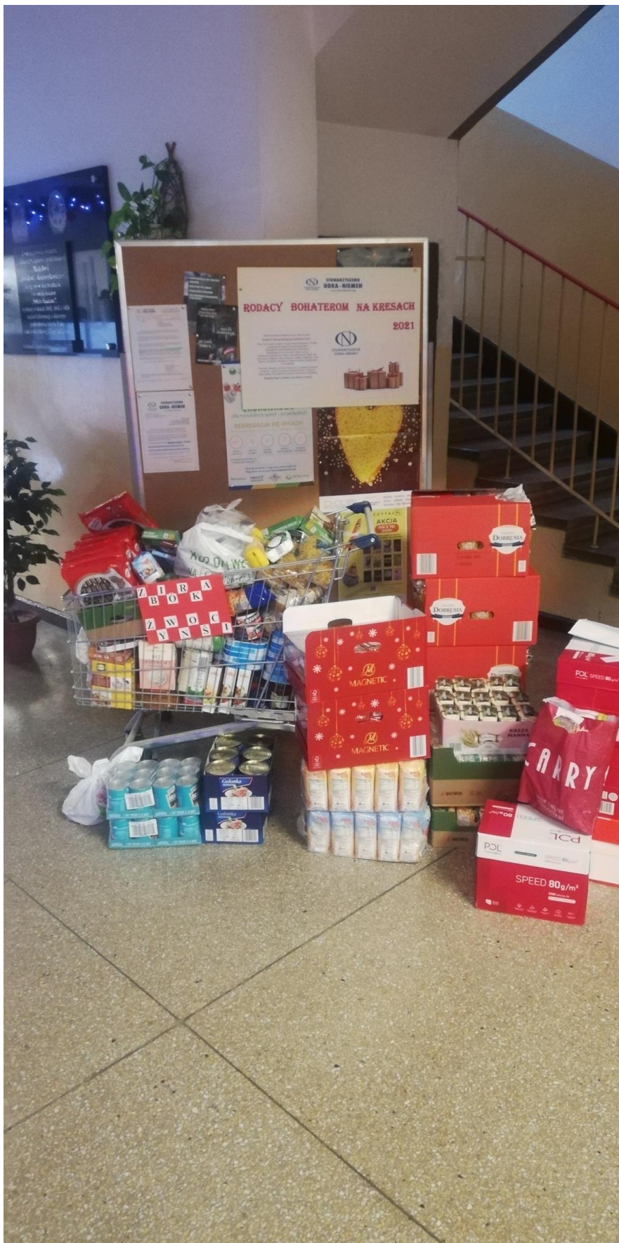
Zbiórka w 6 LO Toruń.