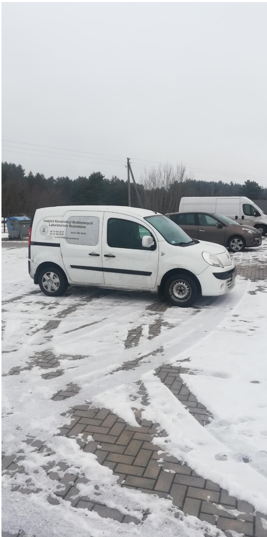
Nasza tegoroczna kolumna transportowa na parkingu w Nowych Świącianach .