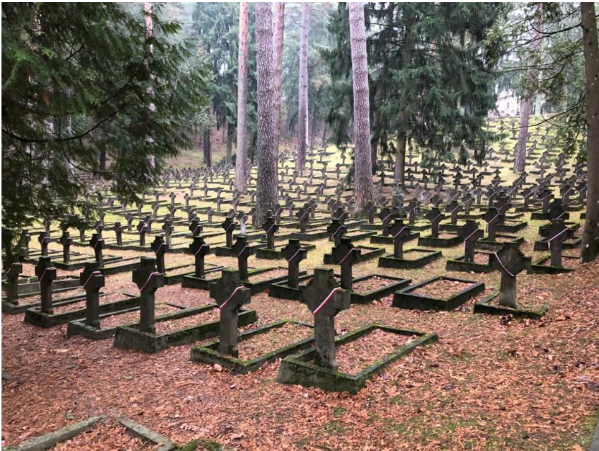
Antokol – Wilno, lokalizacja taka, że nie da się objąć całości na jednym zdjęciu, zawsze jest uporządkowane, szacunek dla miejscowych Polaków dbających o to miejsce.