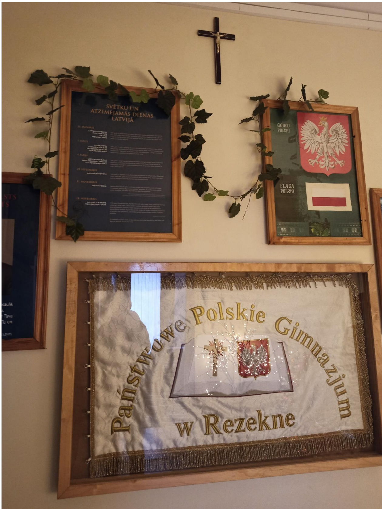
Rezekne na Łotwie