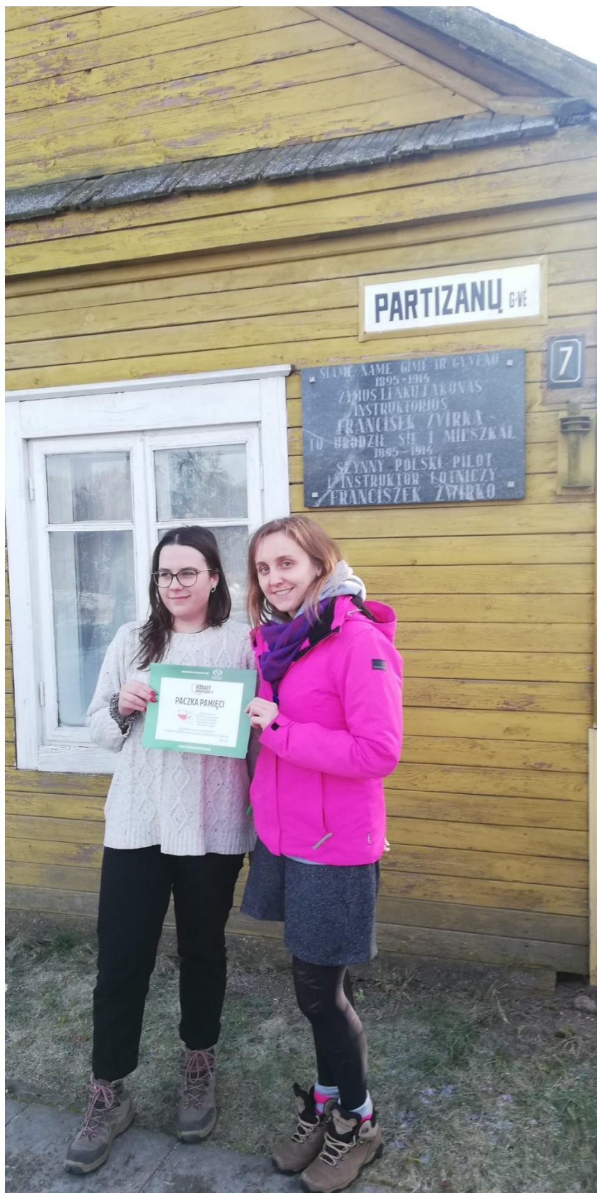
Litwa Świąciany – dom, w którym w latach 1895-1914 mieszkał Franciszek Żwirko