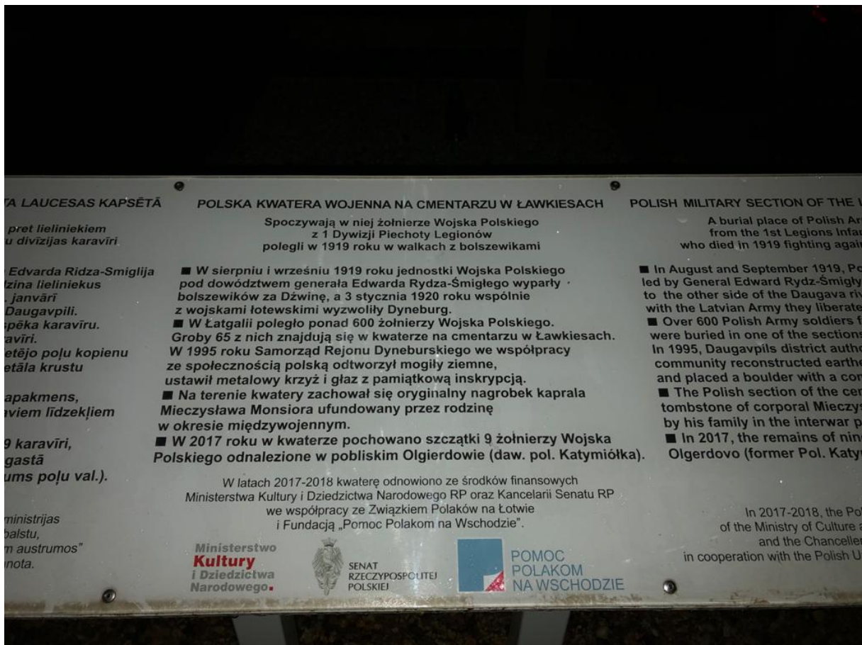
Tablica na cmentarzu polskich żołnierzy w Ławkiesach -Łódź