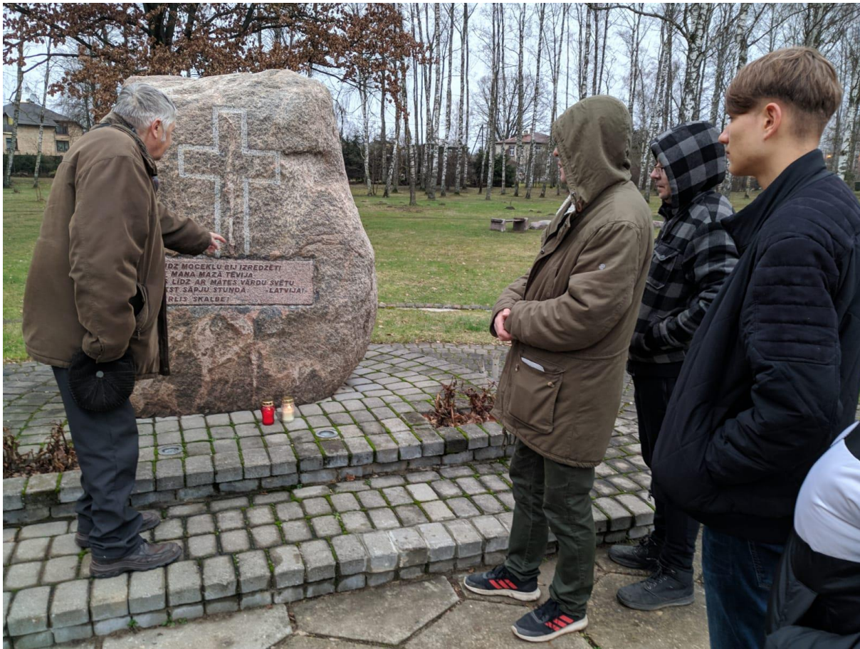
Jelgava – Łotwa – kamień na skwerze przy drodze do stacji kolejowej z której wywożono w 1940 mieszkańców na zesłanie