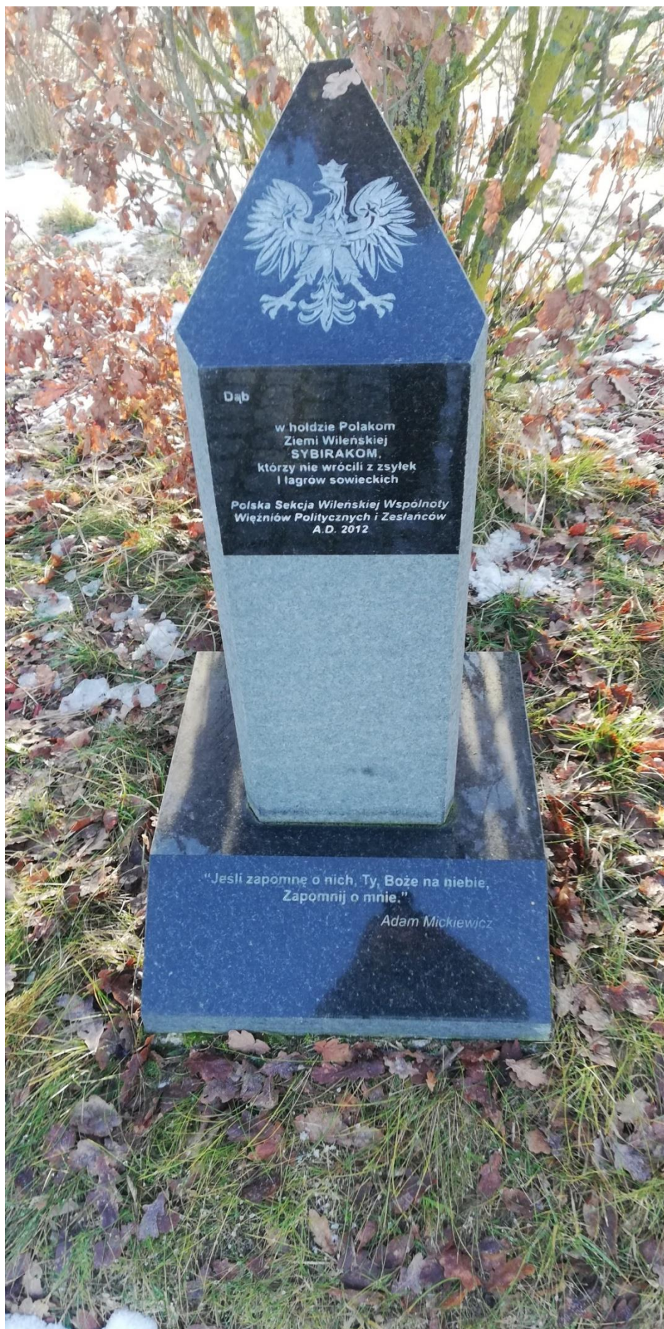
Jedna z tablic pamiątkowych : Aleja pamięci w Zułowie.