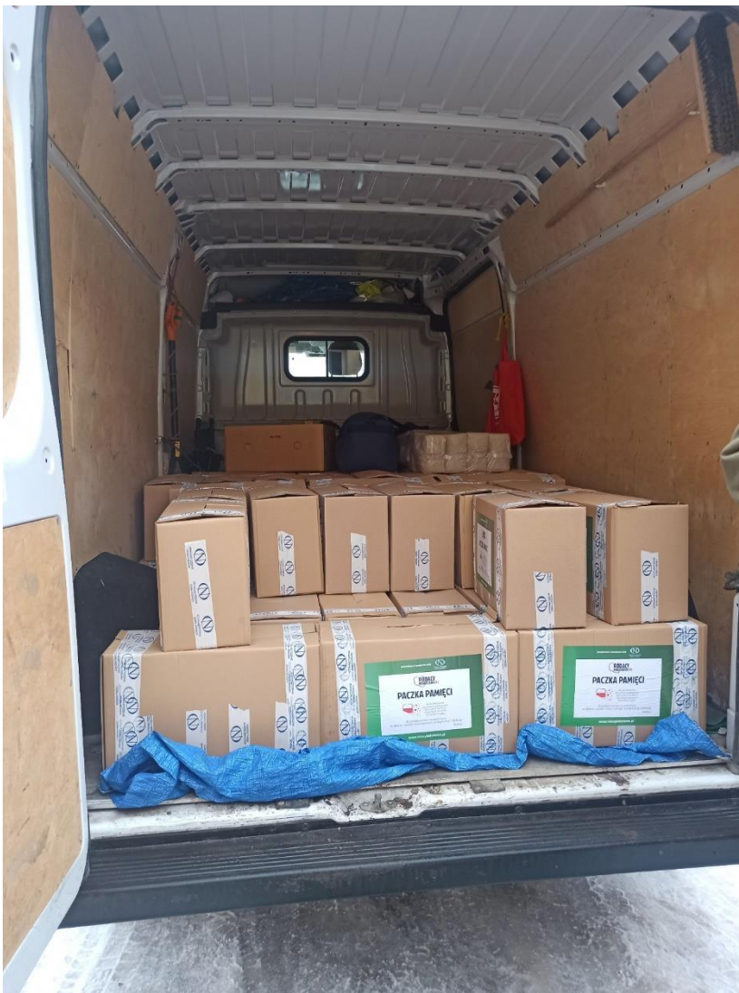
Duże IVECO załadowane, jeśli paczki mają po 15kg to więcej niż dwie warstwy nie wejdą bo się nośność samochodu kończy